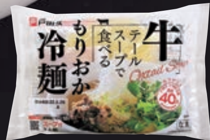
牛テールスープで食べる もりおか冷麺 [2人前]

ひんやりとした牛テールスープは、深みのある旨味とコクにほどよい酸味。強い弾力とコシのある麺で、つるりとスープまで味わう冷麺です。透明な冷たさが夏の新定番。新しいもりおか冷麺との出会いです。