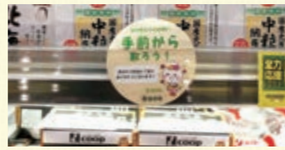
食品ロス削減の取り組みを広げます。