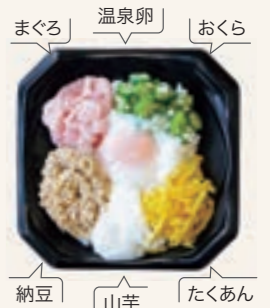
スタミナねばねば丼 酢飯に6種の具材をトッピング。醤油は好みで。

この春、「いか尽くし」と「スタミナねばねば丼」が仲間入り。「手ごろな価格でおいしい!」と人気急上昇中です。