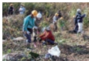
まえさわ生母の下草刈りのようす

2014年に開始した「コープの森まえさわ生母」では、2019年までに市の天然記念物イロハモミジの苗木180本を植樹しました。現在は下草刈りを継続しています。