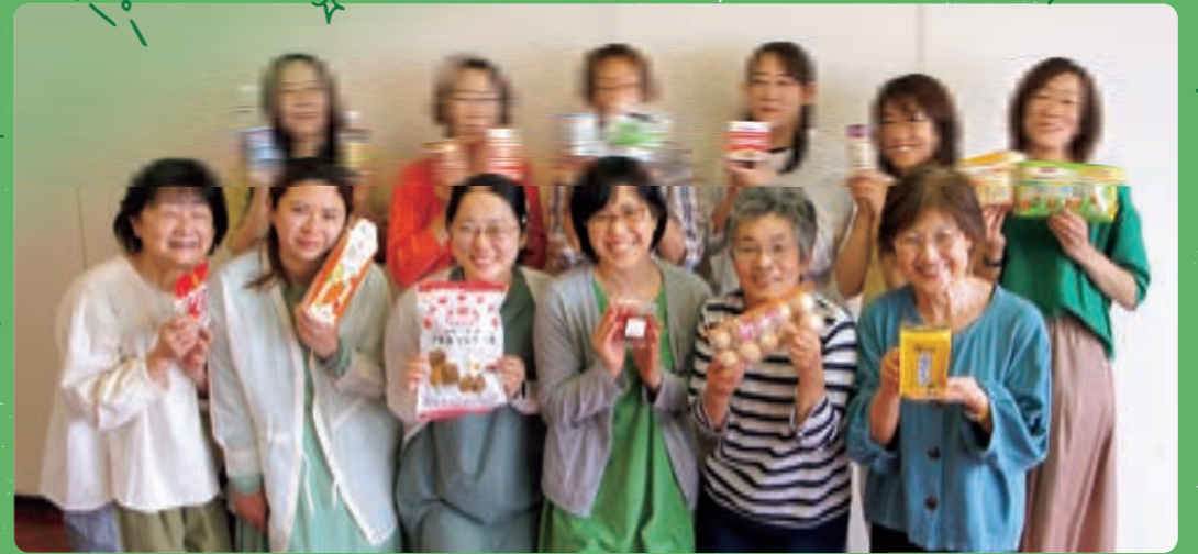
アイコープ商品・産直品、コープ商品への「いいね!」の声が広がっています。

6月10日に第33回通常総代会を開催し、議案はすべて圧倒的な賛成多数で承認されました。 今回は通常総代会で確認された2021年度報告と2022年度計画をお知らせします。