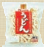
coop 県産小麦 うどん [3食]