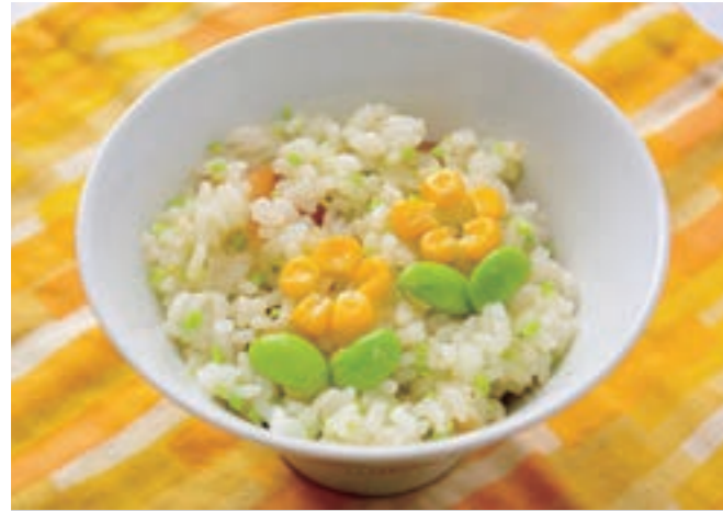
枝豆は刻みますが、お子さんのどに詰まらせないように、よく噛んで食べましょう。