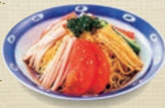
強ちぢれ 中華細麺 [3食]