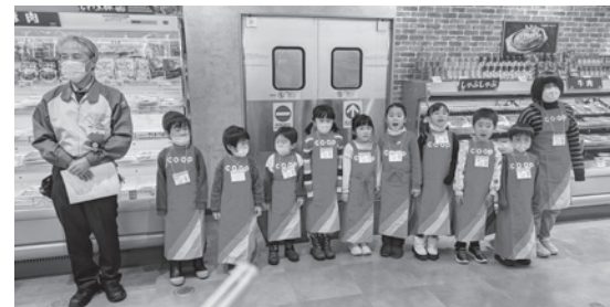
親子が来店して楽しむ企画が広がりました。リニューアルしたベルフ青山で開催した「一日子ども店長」。

2025年度も、2030年ビジョンで掲げた「ともにつくる 暮らしと未来」をめざし、組合員の暮らしを支える事業と活動を着実にすすめます。