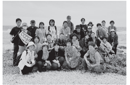
辺野古基地建設のため埋め立て工事が行われている大浦湾・瀬高の浜を見学。